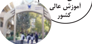
شناسایی نیازهای استانی، گمشده آموزش عالی کشور

رییس مؤسسه آموزش عالی علمی کاربردی جهاد دانشگاهی خاطر نشان کرد کاری که طی چند سال اخیر در دانشگاه جامع علمی کاربردی آغاز شده است، بحث مأموریت‌گرایی است. در حوزه آموزش مهارتی در دانشگاه جامع علمی کاربردی، قدم‌های خوبی برداشته شده است و اگر این حرکت به نحو درست از سوی دانشگاه جامع حمایت شود، فعالیت مراکز به سمت فعالیت‌های تخصصی سوق پیدا می‌کند. به عنوان مثال، یک مرکز علمی کاربردی قوی در حوزه کشاورزی یا گیاهان دارویی، که به صورت متمرکز روی این حوزه کار کرده و در زمینه‌های تخصصی و تخصصی‌تر متمرکز می‌شود، می‌تواند در این حوزه تخصصی بصورت قوی ورود پیدا کند و چون حوزه‌های تخصصی و تخصصی‌تر در گروه‌های صنعت و کشاورزی نیازمند امکاناتی مانند سرزمین و گلخانه‌ها و کارگاه و تجهیزات صنعتی است، لذا این موضوع ممکن است در کوتاه‌مدت برای دانشگاه‌ها و مراکز آموزش عالی علمی کاربردی به لحاظ کاهش تعداد دانشجویان، بار مالی و مشکل‌ساز باشد.