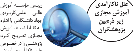
علل ناکارآمدی آموزش مجازی زیر ذربین پژوهشگران

دانشگاه‌ها و مراکز نظام آموزش مهارتی معمولاً ۳۰ درصد آموزش به صورت نظری و ۷۰ درصد باقی‌مانده به شکل عملی و در محیط واقعی کار برگزار گردد. درصفاغه همه‌گیری بیماری کووید ۱۹ باعث شد که بخش زیادی از کلاس‌های عملی حذف شوند. علی‌رغم این محدودیت ما شاهد ابتکارات و خلاقیت‌های زیادی از طرف اساتید بودیم و تلاش شد از طریق انجام پروژه یا کارهای مشابه، محدودیت‌های عدم دسترسی به محیط‌های کارگاهی و آموزش عملی جبران شود. قطعاً مطلوب ما در دانشگاه علمی کاربردی، برگزاری کلاس‌های کارگاهی به شکل حضوری است و با توجه به تسریع واکسناسیون دانشجویان و بهبود شرایط بیماری در کشور، به زودی توانیم فعالیت‌ها را به شکل سابق از سر بگیریم.