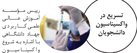
توسیع در دانشجوین و اساتید

با توجه به برگزاری کلاس‌های آموزشی دانشگاه در دو سال اخیر در قالب سامانه‌های آموزش مجازی، ضرورت آموزش مدرسین با نحوه استفاده، تولید محتوا و ارزیابی دانشجویان در سامانه مجازی، معاونت آموزشی جهاد دانشگاهی اقدام به برگزاری دوره توانمندسازی آملی تدریس در آموزش مجازی نموده است. این دوره از اواخر بهمن‌ماه ۱۳۹۹ تا خردادماه ۱۴۰۰ برگزار شد. تعداد ۱۴۰۰ نفر از مدرسین مراکز علمی کاربردی در این دوره‌ها شرکت کرده و موفق گردانند دوره‌ها شده‌اند.