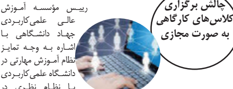
چالش برگزاری کلاس‌های کارگاهی به صورت مجازی

دانشگاه‌ها و مراکز نظام آموزش مهارتی معمولاً ۳۰ درصد آموزش به صورت نظری و ۷۰ درصد باقی‌مانده به شکل عملی و در محیط واقعی کار برگزار گردد. درصفاغه همه‌گیری بیماری کووید ۱۹ باعث شد که بخش زیادی از کلاس‌های عملی حذف شوند. علی‌رغم این محدودیت ما شاهد ابتکارات و خلاقیت‌های زیادی از طرف اساتید بودیم و تلاش شد از طریق انجام پروژه یا کارهای مشابه، محدودیت‌های عدم دسترسی به محیط‌های کارگاهی و آموزش عملی جبران شود. قطعاً مطلوب ما در دانشگاه علمی کاربردی، برگزاری کلاس‌های کارگاهی به شکل حضوری است و با توجه به تسریع واکسناسیون دانشجویان و بهبود شرایط بیماری در کشور، به زودی توانیم فعالیت‌ها را به شکل سابق از سر بگیریم.