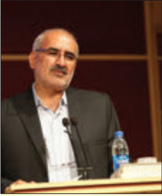
نیاز از متقاضیان باشد افزایش گرایش به سمت آموزش‌های مهارتی، مسئولیت دانشگاه علمی کاربردی و نظام آموزش مهارتی را سنگین‌تر می‌کند.