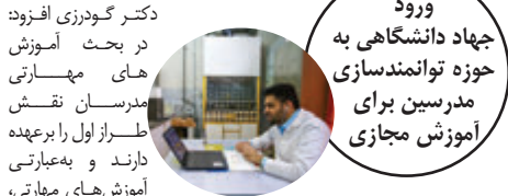
ورود جهاد دانشگاهی به حوزه توانمندسازی مدرسین برای آموزش مجازی

ناکارآمدی آموزش مجازی، عدم آشنایی مدرسین با سامانه‌های آموزش مجازی، کار با زیرساخت‌های موجود، شیوه تدریس، روش‌های تولید محتوا و اساساً، ماهیت آموزش مجازی بوده است.