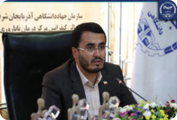
بسیاری دیده است.

دکتر جعفر محسنی رییس سازمان جهاددانشگاهی آذربایجان شرقی نیز در این مراسم اظهار کرد: از آغازین روزهای جنگ تحمیلی کادر درمان همراه و همسنگرزمندهگان در جبهه‌های نبرد حق علیه باطل بوده و امروز سربازان خط مقدم جبهه دفاع از سلامت مردم هستند؛ بر اساس تصمیم شورای عالی اعطای تندیس فدائاری، جهاددانشگاهی متولی تجلیل از خانواده‌های شهدای مدافع سلامت است. در پایان این مراسم با اهدای لوح یادبود از خانواده‌های شهدای مدافع سلامت آذربایجان شرقی تجلیل به عمل آمد.