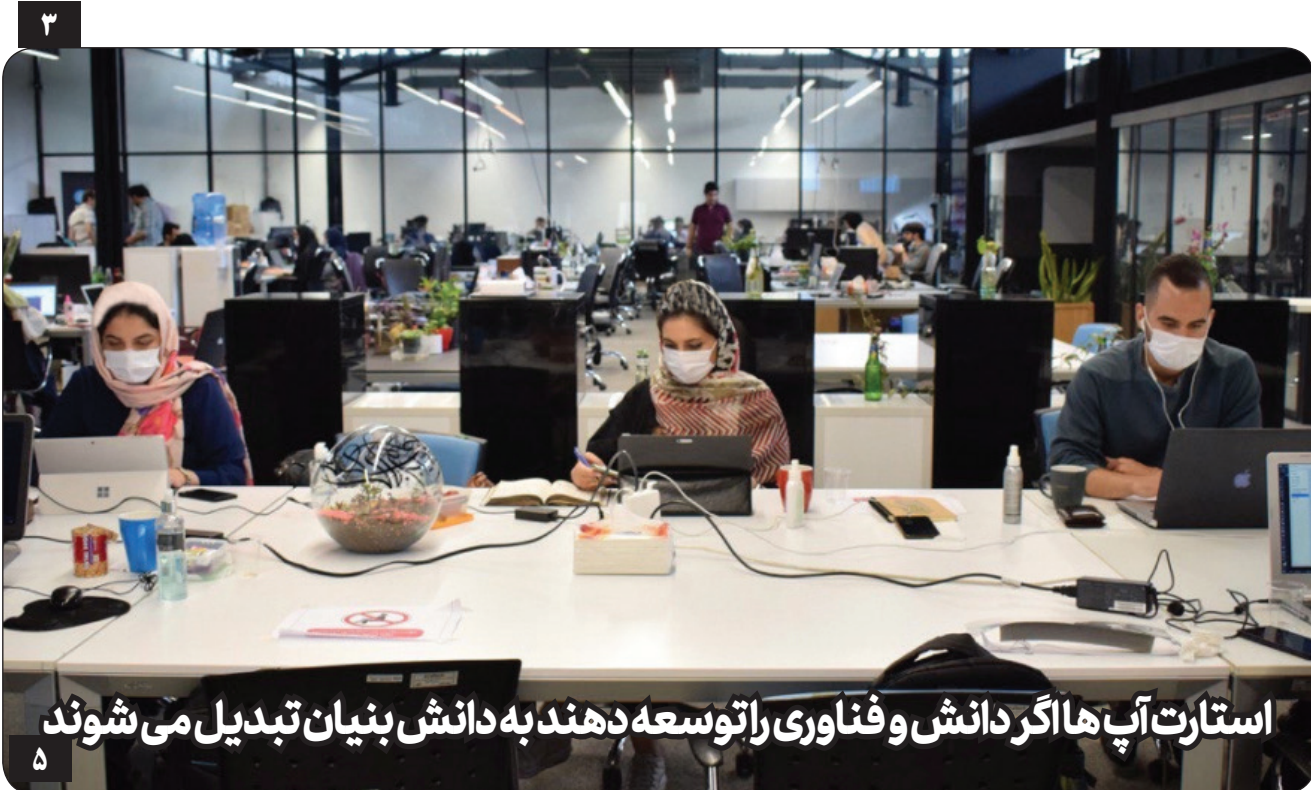
استارت‌آپ‌ها اگر دانش و فناوری را توسعه دهند به دانش بنیان تبدیل می‌شوند