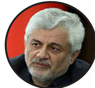
محمد زیا سپهری رئیس سابق موسسه کار و تامین اجتماعی