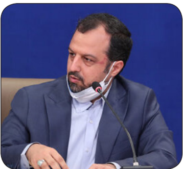
برای اشتغال تخصیص خواهد یافت. خاندوزی ادامه داد: امروز برای نهایسی کردن این بسته، جلسه ای با مدیران عامل بانک های کشور داشتیم و طی روزهای آینده، تخصیص عملی تسهیلات اشتغال در کشور آغاز می شود.

وزیر اقتصاد افزود: بانک های عامل پرداخت کننده این تسهیلات هستند و با توجه به اینکه به صورت اهرمی عمل می کنند یعنی دو تا سه برابر بودجه ای که دولت برای اشتغال در نظر گرفته است را خود بانک ها هم اضافه می کنند، بنابراین با این اقدام، مبلغ بسیار بالاتری