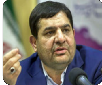
محمد مخبر معاون اول رئیس جمهور مصوبه دولت درباره برنامه ملی تقویت کسب و کار، معیشت مرزنشینان و ایجاد

در آیین نامه فوق تلاش شده است با به کارگیری الگوهای تسهیلگر اشتغال و با همکاری و هماهنگی دستگاه های اجرایی