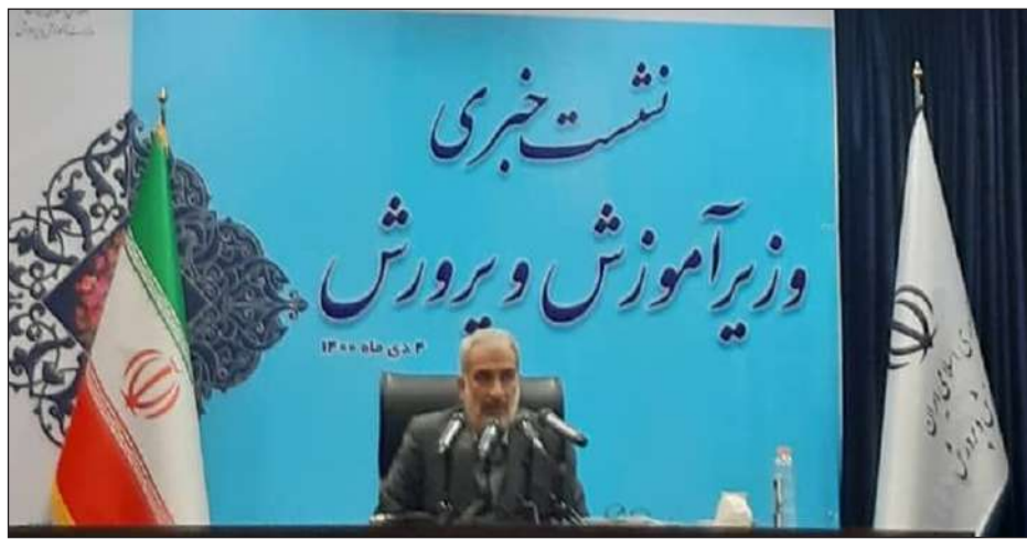
تاکید بر پرداختن به موضوع کار آفرینی و بازار کار

وزیر آموزش و پرورش با اشاره به اینکه یکی از اهداف مهم ما پرداختن به موضوع کار آفرینی و اشتغال است گفت: باید از نظام تک ساختی عبور و به نظام تعلیم و تربیت چندساختی برسیم. اگر رشته های هنرستان ها خوب تعرف و انتخاب شوند مطمئناً تعداد بسیاری جذب بازار کار می شوند. ایجاد سواد، نه سواد اسمی و عملکردی بلکه سواد چندبعدی بسیار حائز اهمیت است و نظام آموزش و پرورش باید این هجرت را داشته باشد که قطعاً برای آن برنامه داریم.