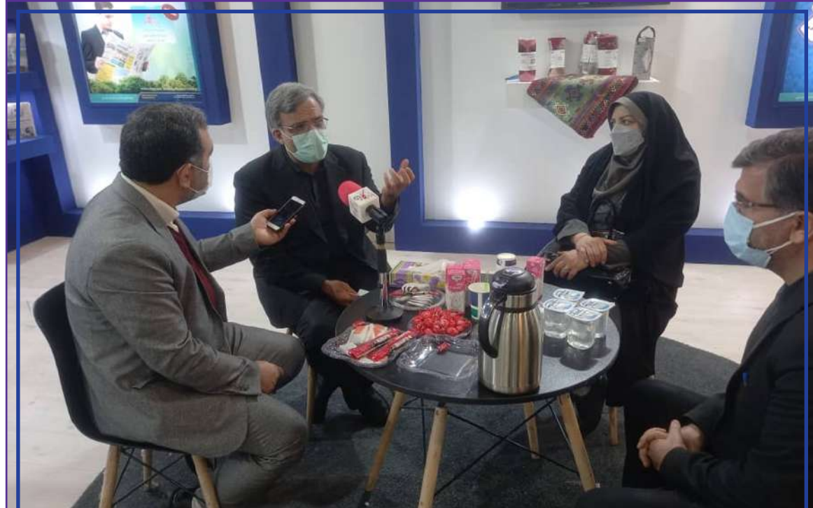
معاون کارآفرینی و اشتغال اداره کل تعاون، کار و رفاه اجتماعی استان تهران در این گفتگو با بازارکار