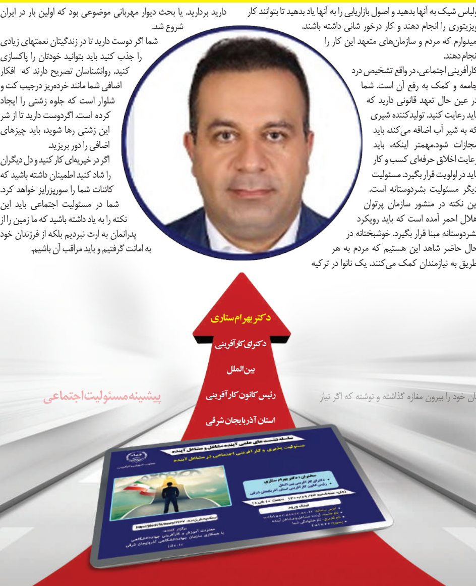
ثان خود را بیرون مغازه گذاشته و نوشته که اگر نیاز

کار آفرین برتر اجتماعی، فردی است که به مشکلات مختلف اعم از اجتماعی ، اقتصادی، محیط زیست و ... توجه دارد و در جهت حل و رفع آن ها تلاش می کند. در واقع باید گفت: یک نگاه اقتصادی وظیفه دارد تا به این سوالات پاسخ دهد که چقدر در مسیرمسئولیت‌پذیری اجتماعی گام برداشته است. به طور مثال یک شرکت بین المللی در زمینه گندم زمانی متوجه شد مردم امکان تهیه لباس ندارند و از گونی های گندم به عنوان پارچه لباس و پوشش استفاده می کنند.از پارچه گلدار و باکیفیت استفاده کرد تا گامی برای ارائه خدمات اجتماعی خود بردارد.