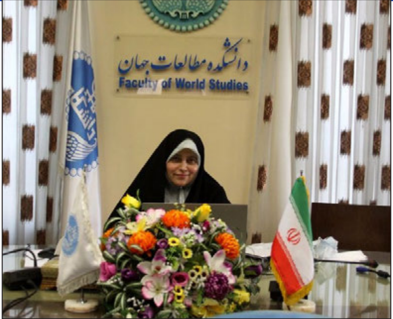
در گفتگو با معاون آموزشی دانشکده مطالعات جهان دانشگاه تهران بررسی شد